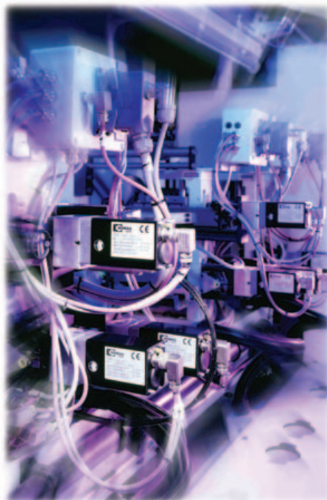
Bild 1: Positioniersysteme an einer Holzbearbeitungsmaschine

Kosten senken durch ein neuartiges Positioniersystem