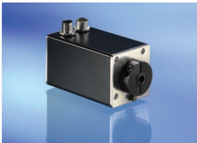
Bild 4: PSE 31x: Wie aus dem Bild ersichtlich, erfolgt die Befestigung mittels Hohlwelle (8 mm) und Klemmring, bei dem nur eine einzige Schraube angezogen werden muss. Ein Verdrehen des Systems wird durch eine Drehmomentabstützung verhindert.

Um das System an die verschiedenen Anforderungen des Anwenders anpassen zu können, müssen bei der Inbetriebnahme eine Reihe von Parametern fest-