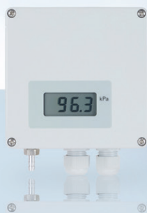
Abbildung: Version mit Display